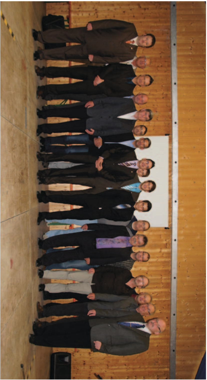
Die Vorstandschaft mit Vergnügungsausschuss der SRVGG Coburg-Ebern